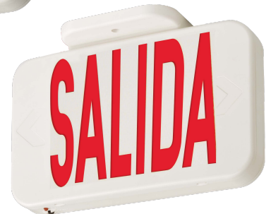
SALIDA EL NOM SALIDA M6