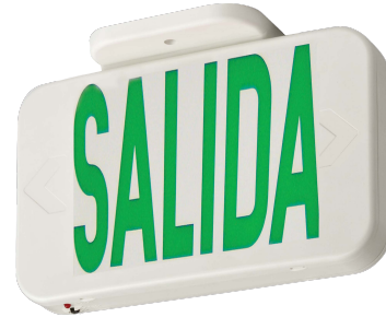
SALIDA EL SALIDA M6 NOM M6

Los letreros de salida Lithonia Lighting® EXG / EXR LED son ideales para aplicaciones de iluminación de emergencia, como escaleras y pasillos. El letrero se entrega con una cara frontal y una placa adicional, disponible en letras verdes y rojas. Ideal para iluminar de manera segura hacia la salida. Montable en muro o techo. Batería de emergencia con duración de 90 minutos en caso de pérdida de energía